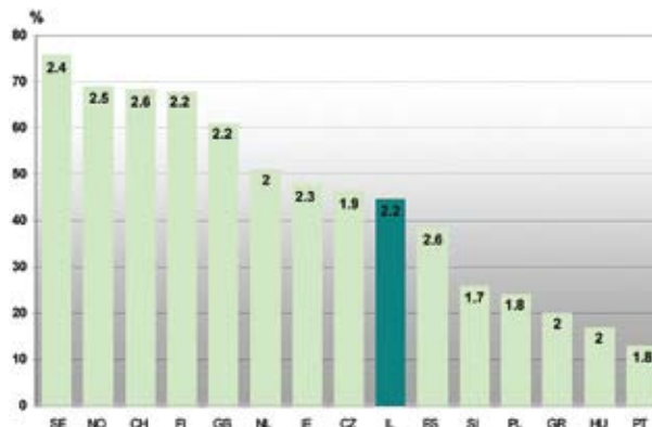
תרשים 2: מעורבות חברתית