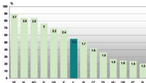
תרשים 1: מעורבות פוליטית

המרוויינים הפעילים השתתפו ב-2.2 פעילויות מסוגים שונים. נראה ששיעורי המעורבות הפוליטית הללו ממקמים את ישראל בדיוק בתפר שבין מערבה וצפונה של אירופה מזה לבין מזרחה ודרומה מזה. צ'כיה מקדימה את ישראל בשיעור ההשתתפות אף שמספר הפעילויות הממוצע לכל אדם מעט נמוך יותר. מכל מקום נראה בבירור שבישראל שיעורי מעורבות פוליטית, במובן הרחב שלה, נמוכים מאלה שבמערב אירופה ובצפונה וגבוהים משמעותית מרמת המעורבות המאפיינת את מזרח אירופה ומדינות דרום אירופה כמו יוון ופורטוגל. נתוני הסבב הרביעי, ואלו שיבואו אחריו, יספקו ממד אורך שיאפשר להבין אם ובאיזה כיוון נעים שיעורי המעורבות הפוליטית של החברה הישראלית.