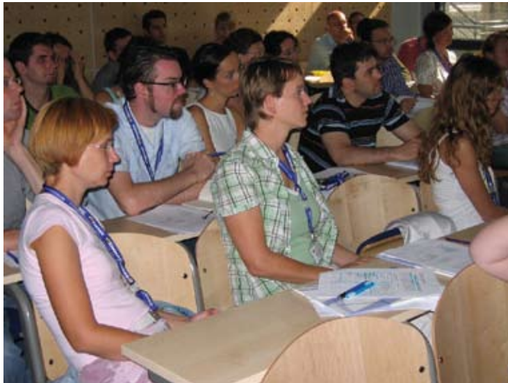
מראיינים בעת הדרכה לסוקרים, באוניברסיטת Ljubljana, סלובניה 2007. מתוך אתר ה-ESS.

היא המחשבה שהון חברתי חיוני לקיום חברה דמוקרטית ולמעורבות התושבים בפעילות פוליטית. על רקע עניין זה הוצגו למשתתפים בסקר פעילויות שונות בשדה הפוליטי (מלבד ההצבעה בבחירות) והם נשאלו אילו מאותן פעילויות הם עשו בשנה שקדמה לסקר. השאלה שהופנתה למרואיינים הייתה זו: "יש דרכים שונות באמצעותן ניתן לנסות לשפר דברים בישראל או למנוע החמרה במצב. האם במהלך 12 החודשים האחרונים עשית משהו מהדברים הבאים?" הפעילויות שנמנו היו פעילות במפלגה פוליטית, בארגון או בקבוצת פעולה כלשהי; חתימה על עצומה; השתתפות בהפגנות; העלאת תרומה; החרמת מוצרים ועוד. נעסוק כאן בתשע מהפעילויות שהוצגו למרואיינים.