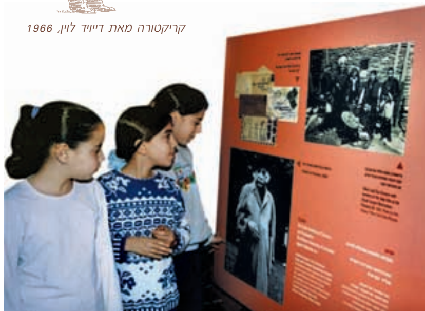
תלמידי בתי ספר מבקרים בתערוכה בבית האקדמיה.