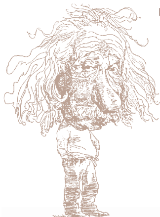
קריקטורה מאת דייוויד לוי, 1966

התערוכה הוצגה באקדמיה בחודשים דצמבר 1999 עד מרס 2000. הוצגו בה פריטים מקוריים מתוך ארכיונו האישי של אלברט איינשטיין.