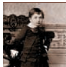
התצלום המוקדם של אלברט איינשטיין, ביותר, הידוע,

התערוכה הוצגה באקדמיה בחודשים דצמבר 1999 עד מרס 2000. הוצגו בה פריטים מקוריים מתוך ארכיונו האישי של אלברט איינשטיין.