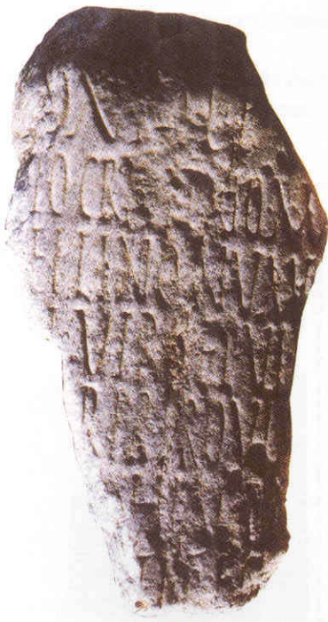
כיתוב על שבר עמוד מקיסריה. ההקדשה ללוקיוס קוסוניוס גאלוס, המושל הרומי של יהודה בשנת 120 בערך.

במלאות יובל להקמת המדינה ערכה האקדמיה הלאומית הישראלית למדעים יום עיון ובו סקרו כמה מן החוקרים הבולטים בישראל את תולדות תחום מחקרם.