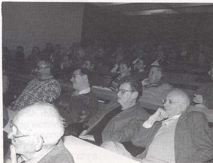
מאזינים לדברי פרופ' קולקובסקי על האפוקליפסה

כ"ז בחשוון תשנ"ח (27 בנובמבר 1997) ערב לזכרו של פרופ' יצחק טברסקי בהשתתפות: פרופ' עזרא פליישר, פרופ' מנחם בן-ששון, פרופ' יוסף הקר, פרופ' אביעזר רביצקי, פרופ' ישראל תא-שמע