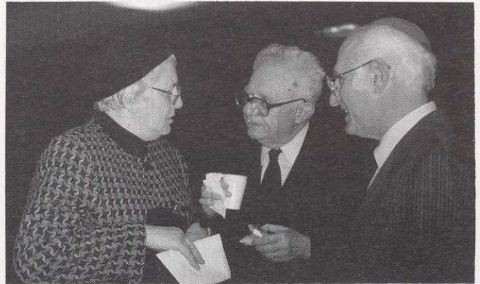
פרופ' עזרא פליישר, פרופ' שמואל נ' אייזנשטדט וגב' עטרה טברסקי בערב הזיכרון לפרופ' יצחק טברסקי

כ"ז בחשוון תשנ"ח (27 בנובמבר 1997) ערב לזכרו של פרופ' יצחק טברסקי בהשתתפות: פרופ' עזרא פליישר, פרופ' מנחם בן-ששון, פרופ' יוסף הקר, פרופ' אביעזר רביצקי, פרופ' ישראל תא-שמע