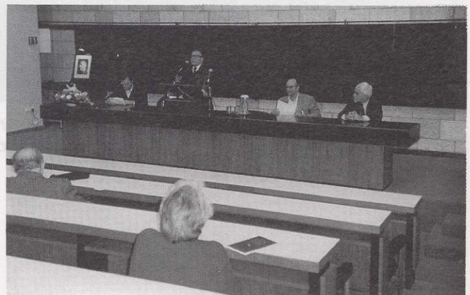
עשרים שנה למותו של פרופ' וירשובסקי