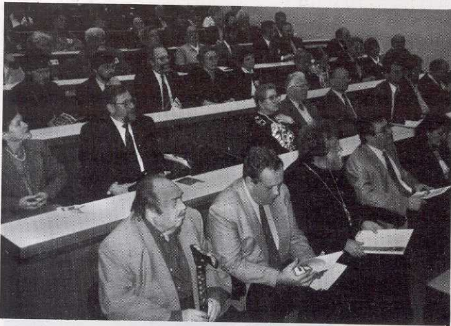
קהל המשתתפים בכנס "יחשלים בתרבויות ובדתות הסלויות". טקס הפתיחה נערך בבית האקדמיה (כ"ז בכסלו תשנ"ז).

כ"ט בכסלו תשנ"ז (10 בדצמבר 1996) האספה הכללית הפתוחה של האקדמיה - חנוכה תשנ"ז, הרצאות החברים החדשים: