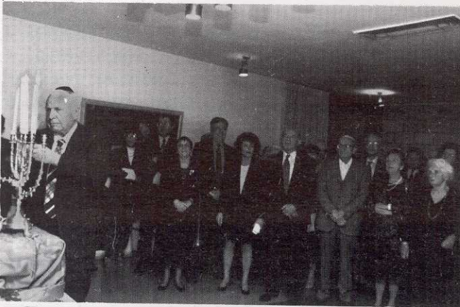
פרופ' אפרים קציר בטקס הדלקת נרות חנוכה בארוחת הערב השנתית של חברי האקדמיה, חנוכה תשנ"ז

כ"ט בכסלו תשנ"ז (10 בדצמבר 1996) האספה הכללית הפתוחה של האקדמיה - חנוכה תשנ"ז, הרצאות החברים החדשים: