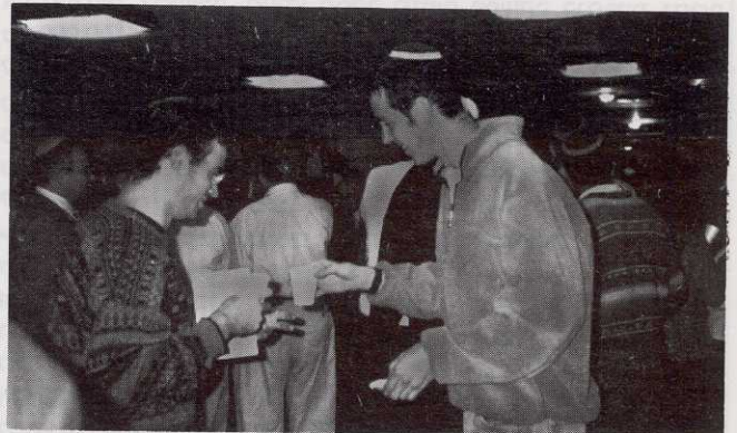
בני נוער רבים בקהל הנוכחים בערב שנוערך במלאת חמש שנים לפטירתו של פחפ' אפרים א' אורבך ז"ל בהשתתפות דור ההמשך.

כ"א בכסלו תשנ"ז (2 בדצמבר 1996) יום עיון במלאת חמש שנים לפטירתו של פחפסור אפרים א' אורבך ז"ל סוגיות במחקר התלמוד הרצו: ד"ר שלמה נאה, פחפ' מנחם קיסטר, ורד נעם, ד"ר מרדכי סבתו, עוזיאל פוקס, ד"ר שמחה עמנואל