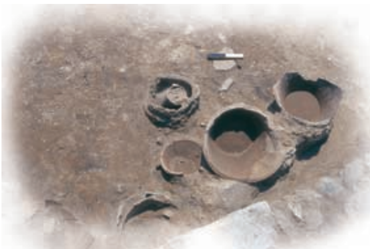
כלי חרס על רצפת אחת החנויות.

שלטונות העיר ותושביה לא שיקמו את העיר כהלכה. לאמתו של דבר, כבר בשלבים מוקדמים של החפירה הבחנו בסימנים של חולשה ושל ירידה במצב העיר ותחזוקת שטחי הציבור בה. לפחות שני אירועים שהחלישו את העיר מוכרים לנו היטב. האחד אירע בשנת 529, בעת מרד השומרונים בארץ ישראל נגד השלטון הביזנטי הנוצרי. בבית שאן הייתה קהילה שומרנית חשובה וידוע לנו כי היו מהומות קשות במקום וכי העיר ניזוקה. האירוע האחר פגע בכל מזרח האימפריה. זו מגפת הדבר שפגעה קשה בארץ ובמזרח בחורף של סוף 541 וראשית 542. אין ספק כי גם בית שאן כמו הארץ כולה דולדלה מאוד מחמת המגפה. עכשיו נוכל למנות גם את האירוע המקומי הזה של השרפה הקשה עם גורמי הירידה של בית שאן-סקיטופוליס. השרפה פגעה בשטחים רחבים הרבה יותר, בעיקר באזור שמצפון לחנויות. בסביבת החנויות עצמן התבטא הדבר בהסרת המדרכה המוגבהת שלפני החנויות והעמקת פני השטח לשם בנייה במקום. בפעולה זו נהרס הסטיו, התושבים ויתרו על הנגישות מצד הרחוב אל החנויות, והן לא שוקמו עוד.