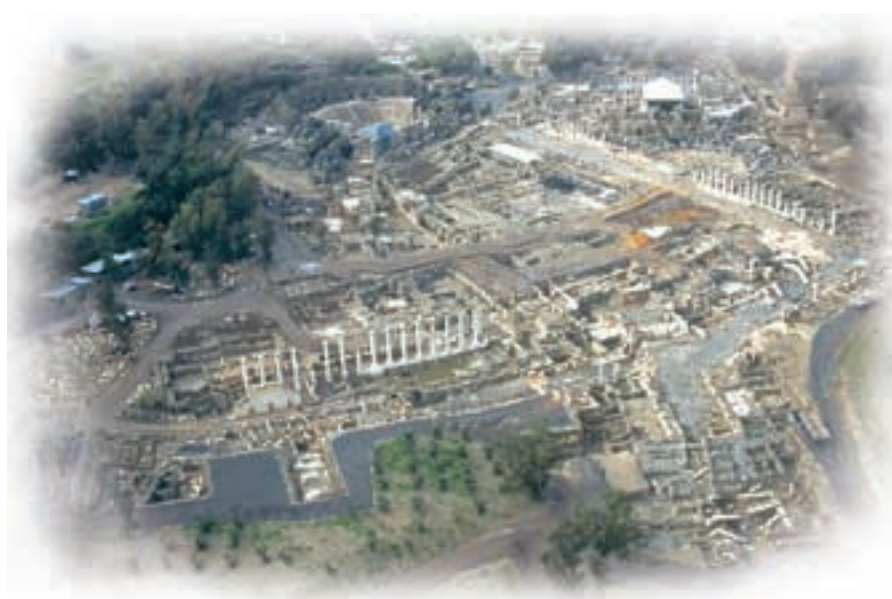
תצלום אוויר של מרכז בית שאן הרומית-ביזנטית.

של כלי חרס ושל ממצאים אחרים שהתגלו בחנויות. ידע זה מאפשר גם לתארך מבנים במקומות אחרים שהתגלו בהם כלים דומים ואשר אין להם תיארוך אחר חוץ מממצא כלי החרס. כידוע, שיטה זו היא העומדת בבסיס החפירה הסטרטיגרפית והארכאולוגיה ההשוואתית, היינו הפרדת שכבות היישוב באתר הנחפר, תיארוך, והשוואת הממצאים בין האתרים כדי להגיע לתיארוך נכון ולהעבירו מאתר אחד למשנהו. התנאי לקיומו של מחקר השוואתי זה הוא האפשרות להוכיח כי השכבה חתומה, כלומר לא הופרעה ולא חדרו אליה שברי חרס או מטבעות בתקופה מאוחרת. מצב "נקי" מעין זה מצוי הרבה באתרים שהתקיימו תקופה אחת בלבד או בשטחים שניטשו לתקופה ממושכת. בעיר בית שאן התקיימו המבנים שנים רבות, אך חלו שינויים ותיקונים ותושבים של תקופה אחת חדרו לא אחת אל תוך שכבת היישוב הקודמת כשביקשו אבני בניין נטושות או כאשר הניחו יסודות לבנייניהם או חפרו בורות אשפה ליד בתיהם.