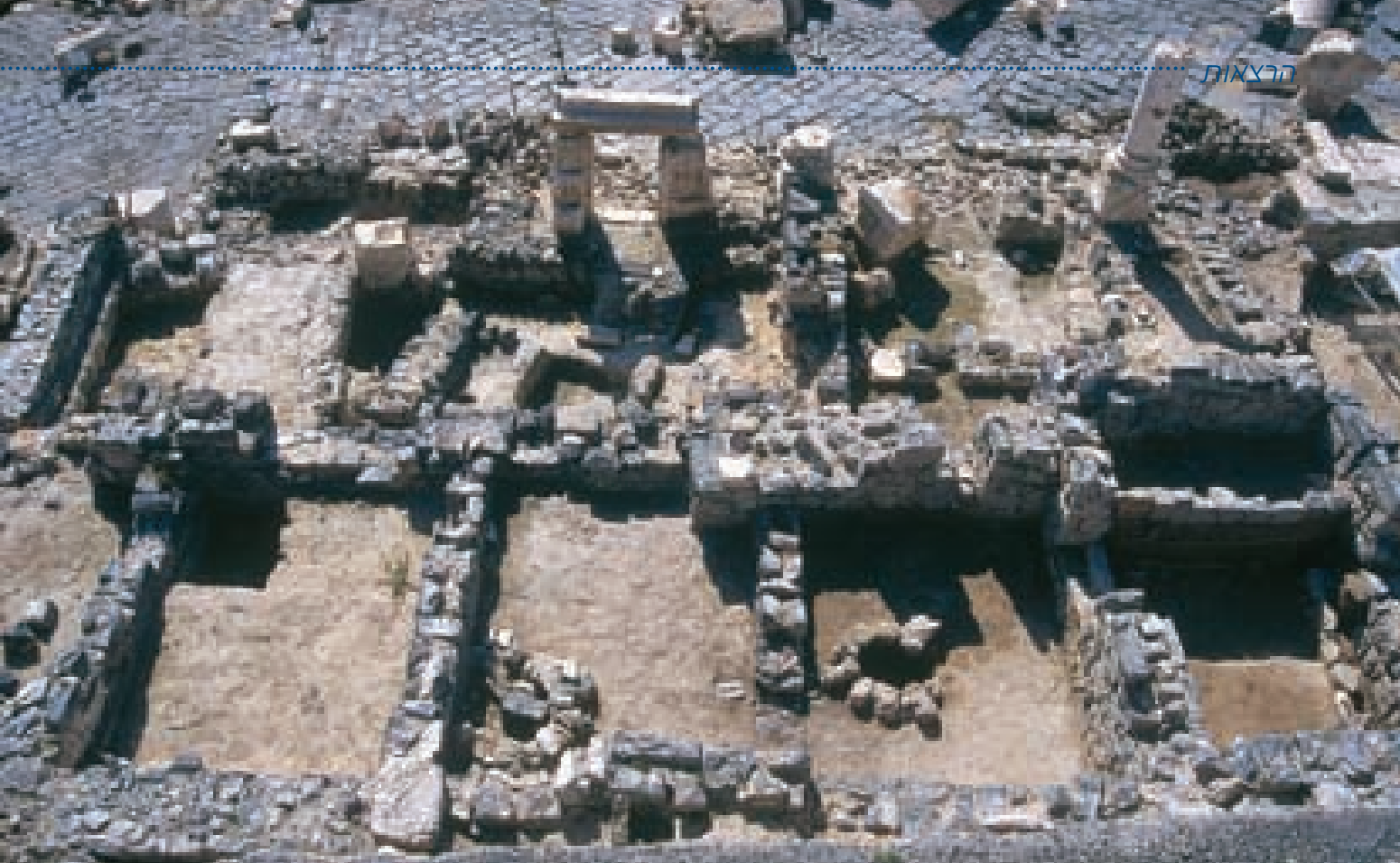
החנויות הביזנטיות בחפירה (בתחתית התמונה). מעבר להן שטח הסטיו הרומי שרצפתו הוסרה כבר בתקופה הביזנטית.

היוונית "סולומון", כלומר שלמה, בכתב ראי משני צדיו. האסימון הרביעי שבור ואינו ניתן לפענוח. אולי הוא מראה דמות מלאך מעופפת למרגלות גזע הצלב.