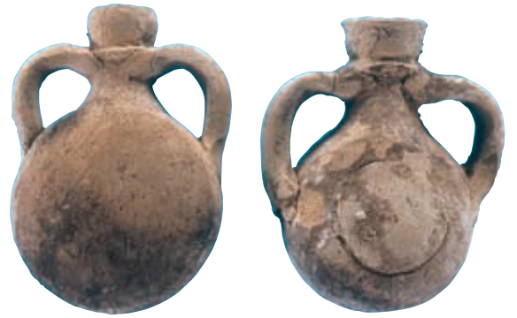
צפחות קטנות (אמפולות) לשמן או מים קדושים שנמצאו באחת החנויות.