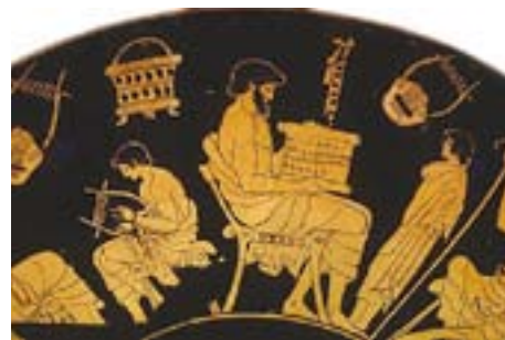
תמונות מבית ספר באתונה. ציור כד מן המאה החמישית לפנה"ס, Berlin F 2285.

היסטוריון החינוך הדגול אנרי־אירנה מרו ( Marrou ), איסוקרטס, ולא אפלטון, הוא שהיה למחנכה של יוון של המאה הרביעית, ולאחר מכן של העולם ההלניסטי־רומי בכללו.