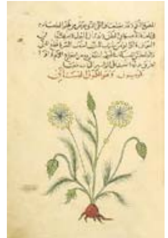
תרגום לערבית של דיוסקורידס. בגדד 1334. שמור בארכיון הפפירוסים של אוניברסיטת ז'יק שבצפון קרוליינה.

עניין זה מחזיר אותנו לוויכוח על חוק בתי הספר של יוליאנוס שבו פתחתי את הדיון. הנוצרים הקדומים לא היו מעוניינים בקנון יצירות המופת של יוון הקלסית לעצמו, אך הם היו מעוניינים עד מאוד שילדיהם, בד בבד עם היותם נוצרים טובים, גם יתפקדו ברמה גבוהה מבחינה אישית וציבורית וגם יהיו בעלי כישורים שיאפשרו להם להתמודד בהצלחה עם אתגרים אינטלקטואליים. קלמנט מאלכסנדריה (150–215 לספירה) אפילו סבר כי "החינוך היווני" מקורו