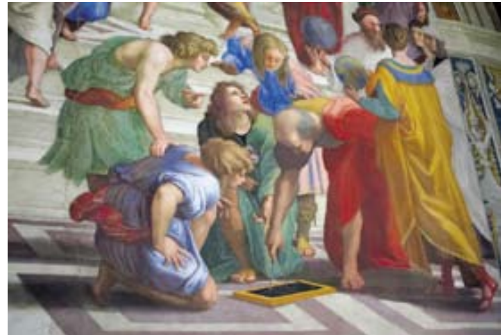
קטע מהציור "האסכולה האתונאית" של רפאל, 1509-1510.

אינני חולקת על עצם התפיסה בדבר טיבו של "ההון התרבותי", אך אני חולקת גם חולקת על הנגזר ממנה. לפי מיטב הבנתי, הקריאות להחלפת הקנון ועמן ההפליה השיטתית של החינוך העיוני הן תקדים מסוכן שאין לו הקבלה בהיסטוריה. אפילו סקירה שטחית של מעמדים בעבר שבהם הוחלפה השכבה השלטת באליטה חברתית