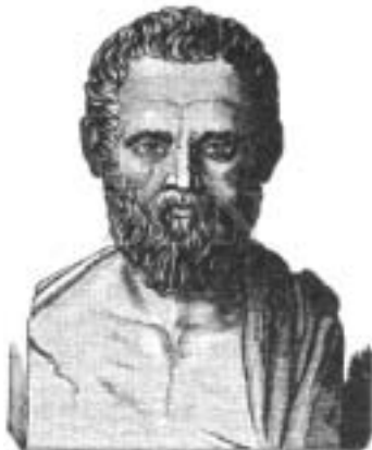
איסוקרט. איור מן המאה ה־19.

אנו ניצבים אפוא בפני פרדוקס. מחד גיסא יש להניח כי בכל רגע נתון הקנון התרבותי הקיים אכן משרת את האינטרסים של הקבוצות השליטות בחברה. לפיכך יש לצפות כי עלייתן של אליטות חדשות תביא בהכרח להחלפת הקנון. מאידך גיסא ראינו כי לא אלה היו פני הדברים במעמדים דומים בהיסטוריה. במקום להחליף את הקנון הקבוצות החדשות שעלו לעמדות כוח נאבקו על ניכוסו דווקא. תהליך דומה מתרחש גם בימינו אנו. בד בבד עם הקריאות להחלפת הקנון אנו עדים למאמצים חוזרים ונשנים מצד קבוצות שבעבר לא הייתה להן גישה אליו להפכו לרלוונטי גם מבחינתן. הזרם האפריקני-אמריקני המנסה להתחקות אחר מקורות אפריקניים של הציוויליזציה הקלסית הוא אחת הדוגמאות לכך. דוגמה אחרת היא ספרו של אדוורד סעיד Culture and Imperialism (1993), ששם לו למטרה "לקרוא מחדש" את "הארכיון התרבותי" של המערב כדי לעשותו רלוונטי לאומות הקולוניאליות שלא נטלו חלק בגיבושו. נדמה לי אפוא כי הקבוצות המקופחות מבינות את ערכו האמתי של ההון התרבותי טוב יותר מהתאורטיקנים ומקברניטי החינוך למיניהם.