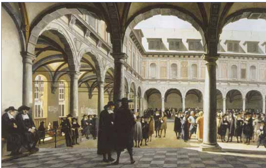
הבורסה הישנה של אמסטרדם (1668), שמן על בד מאת יוב ברקהיידה (Job Berckheyde).

הפרדיגמה של הקונפסינוליזציה פותחה על ידי היסטוריונים גרמניים שביקשו להציע הסבר כולל להתרחשויות הדתיות והפוליטיות באירופה בעת החדשה המוקדמת. מאמצע המאה השש־עשרה נוצרו בריתות בין ההנהגות הפוליטיות לבין הכנסיות הנוצריות השונות באותן מדינות. במקומות שבהם קיבלו השליטים את הדת הלותרנית, לשם הדוגמה, הפכה הלותרניות לדת הרשמית של המדינה ונאסר על המשך קיומה של דת אחרת. השלטון הפוליטי ראה בכנסייה בעלת ברית שמאפשרת לו לחזק את השלטון המדיני שלו, והכנסייה ראתה בשלטון הפוליטי אמצעי לביצור מעמדה של הדת באותה טריטוריה. למרות ההבדלים שהיו קיימים בין החברות הנוצריות השונות היו התהליכים שהביאו לעיצוב דמותן דומים להפליא. הקונפסינוליזציה הוסיפה עצמה לריכוזיות הפוליטית. המדינה הטרנס־מודרנית נזקקה לדת כדי לעצב את זהותה וגבולותיה. היא גם הצליחה לעתים