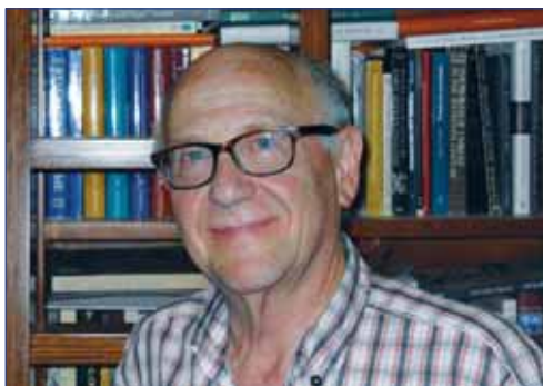
פרופ' יוסף קפלן

מסוף המאה השש־עשרה, את התחייה הדתית־תרבותית הזאת של הקהילות היהודיות בתחומן? התשובה על שאלה זו מורכבת וקשורה בין היתר להתפתחות המדיניות המרקנטיליסטית שהעניקה משקל יתר לתועלת הכלכלית על חשבון השיקולים הדתיים המסורתיים. מדינות כמו הרפובליקה ההולנדית, אנגליה וצרפת, שהיו בעלות אינטרסים טרנס־אטלנטיים (ייסדו בין היתר מושבות בעולם החדש), השכילו לראות את התועלת המסחרית שהייתה צפונה בחובם של אותם סוחרים בין־לאומיים, יהודים אשר ביקשו לכוון בתחומן את מרכזי פעילותם הכלכלית. "היהודים החדשים" שהגיעו מספרד ומפורטוגל היו בעלי ניסיון נרחב בסחר הקולוניאלי. בקיאותם בנתיבי הסחר הבין־לאומי, הסניפים הרבים שהחזיקו במקומות שונים בעולם וההון העצום שעמד לרשותם הפכו אותם לסוכנים אטרקטיביים בעיני מי שביקשו להרחיב את תחום השפעתם הגלובלית. כמו כן בעקבות הרפורמציה ומלחמות הדת שפרצו באירופה במאה השש־עשרה בין קתולים לפרוטסטנטים איבדה הכנסייה הקתולית את הבלעדיות אשר אפיינה את מעמדה בימי הביניים, והכנסיות החדשות (הקלוויניסטית, הלותרנית ועוד) ערערו על המונוליטיות הדתית החברתית שלה. העולם כבר לא היה מאופיין בחלוקה המסורתית של נוצרים לעומת יהודים. הקלוויניסטים ההולנדיים למשל ראו בקתולים אויב מסוכן הרבה יותר