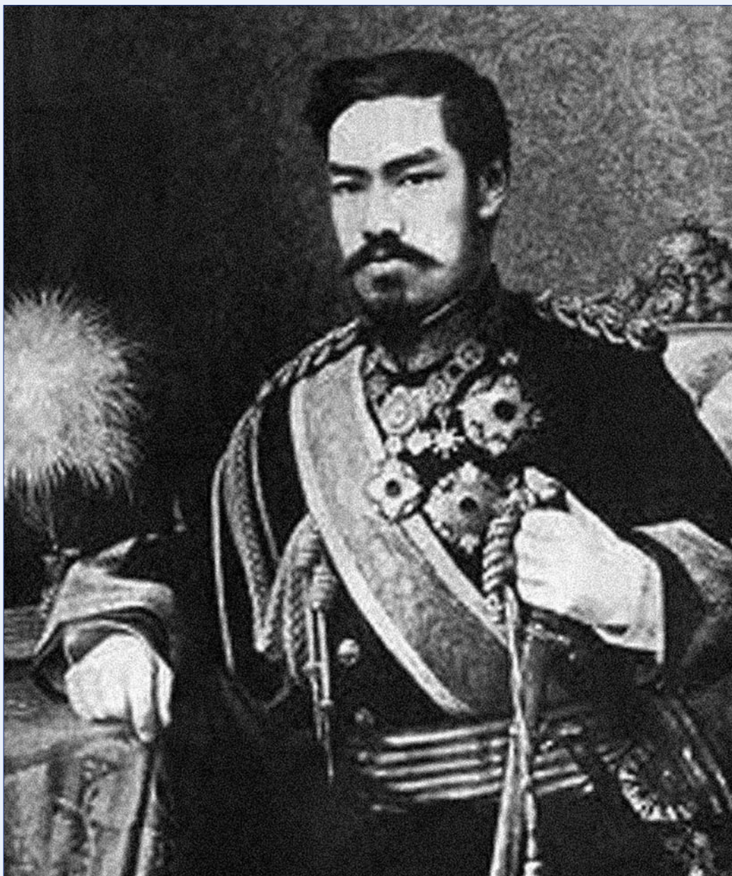
הקיסר מייג'י בבגדי מלוכה מערביים

יכולים לבצע את המודרניזציה המהירה מבלי לעורר התנגדות וליצור אנרכייה. מוסד הקיסר גילה גמישות ביכולתו להתאים את עצמו לנסיבות המשתנות. הכיבוש היחיד שיפן ידעה, זה של ◀