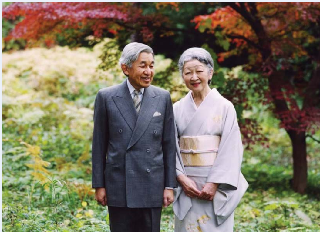
הקיסר אקיהיטו ואשתו הקיסרית מיצ'יקו

ולהקים שושלת קיסרית משלהם. הם אף לא ניסו להצטרף למשפחה הקיסרית באמצעות נישואין או אימוץ וכיבדו את הכלל שרק צאצא ביולוגי של קיסר בקו הגברי יכול לכהן בתפקיד זה.