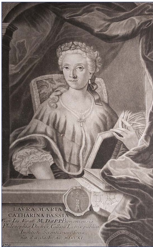
יוהאן יעקב הייד (Johann Jakob Haid): דיוקן המדענית לאורה באסי משנת 1745 לערך (מאוסף הדיוקנאות של ספריית ה־Archiginnasio בבולוניה).

המאות השבע־עשרה והשמונה־עשרה היו נשים לא מעטות מקרב האליטה מעורבות בפעילות התרבותית והמדעית שהתקיימה בסלונים בארצן – בעיקר כפרוניות, כמאזינות לדיונים תאורטיים