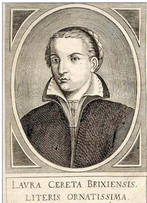
דיוקן ההומניסטית לאורה צ'רטה מעמוד השער של אוסף איגרותיה, שהתפרסם לאחר מותה (1640)

ההשכלה האוניברסיטאית כהכשרה מקצועית שנועדה להכין את הלומדים לקריירה כמרצים לתחומים שונים של "האמנויות החופשיות" (artes liberales, אותם תחומי ידע שנועדו לאנשים החופשיים, שאינם משועבדים); לקריירה בשירות הכנסייה; או לעבודה בתור רופאים או משפטנים. החשיבות הרבה שיוחסה לשמירה על תומתן של נשים והמוסכמות החברתיות שלא ראו בעין יפה