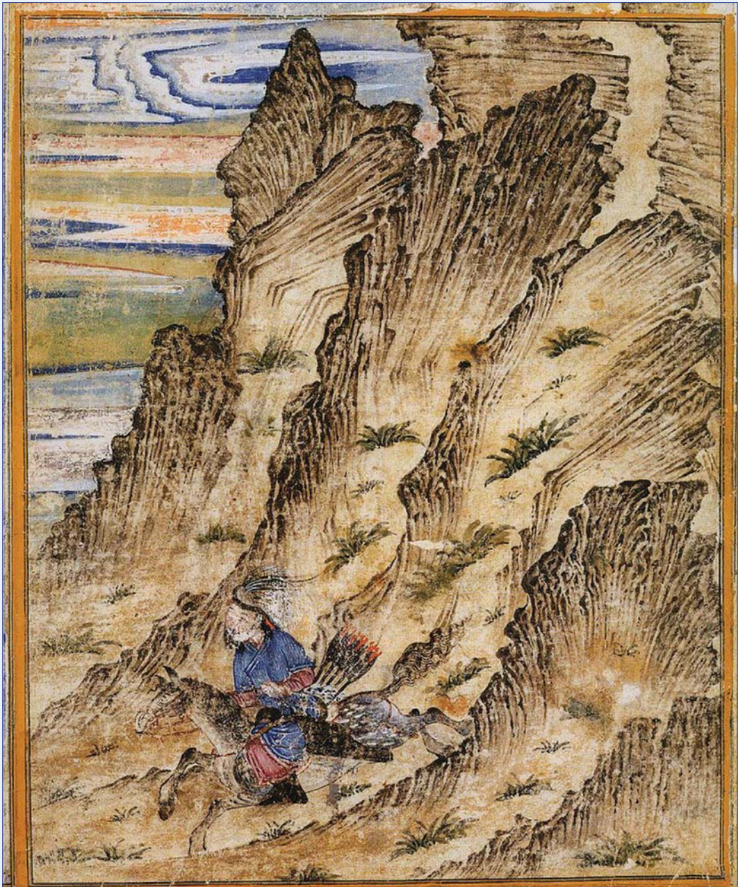
רססם, הגיבור של השאה נאמה, בלבוש מונגולי על רקע נוף בהשפעה סינית. איור לשאה נאמה, איראן המאה הארבע עשרה.

לסוסים המדושנים של משתפי הפעולה עם המשטר החדש, שנהנו מהשגשוג שחולל. מסחר מילא תפקיד מרכזי בשגשוג הכלכלי ובחילופי התרבויות: המונגולים עודדו קשרים כלכליים שהגיעו