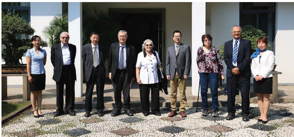
חברי המשלחת הישראלית עם מארחיהם הסינים, אוקטובר 2015

פרופ' רות ארנון, הנשיאה היוצאת של האקדמיה, שעמדה בראש המשלחת, מסרה כי בשנים האחרונות גדל והורחב מאוד היקף הפעילות המדעית בין הארצות, והוא כולל מאות חוקרים ומדענים ישראלים המבקרים מדי שנה בסין וכן ביקורי מאות מדענים סינים בישראל. לדוגמה, שני חברי האקדמיה למדעים וחתני פרס