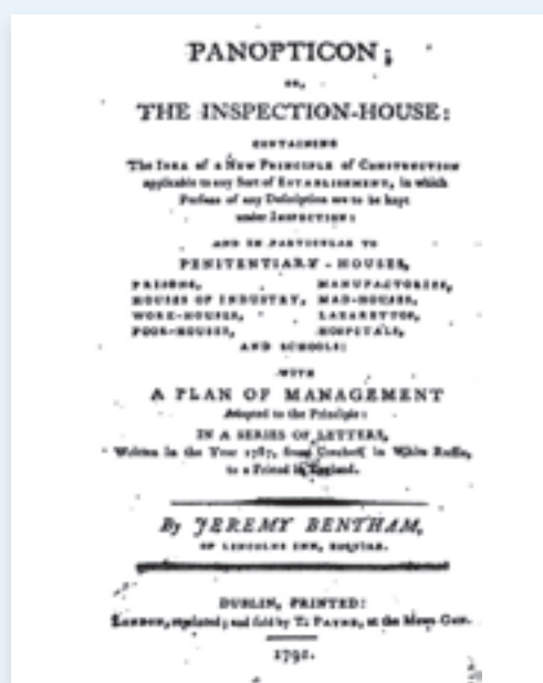
עמוד השער של המהדורה הראשונה של "פנאופטיקון" (דבלין, 1791)

בנת'ם לתעד כמה תופעות גלויות ובלוטות. קטעים מן היומנים ומהמכתבים שאותם אני חוקר זה שנים בכמה ארכיונים באנגליה, עוסקים ביהודי העיירות. ניתן למצוא בהם מפתחות להבנת תמונת העולם של נוסע מערבי, איש עידן הנאורות, בשוליים המזרחיים של היבשת. עיון במפגש בין בנת'ם ליהודי העיירה מעורר תהיות על הדרך שבה מתווים עד היום אידאולוגיה, פוליטיקה וגם אנאכרוניזם גרידא, כיווני מחקר היסטורי בתהליכי המודרניזציה של היהודים.