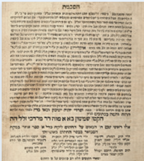
הסכמת ר' שמשון בן מרדכי מסלונים לספר "אוקלידוס"

במסעו חזרה אל אנגליה לן בנת'ם בעיר סלונים: "[...] הוכרתי להיזקק לחדר אצל יהודי, לא פונדק אלא בית פרטי – שהיה כבר מוסק וערוך כראוי. הוא תבע שני רובלים, אך לקח אחד. שולחנות 3, אחד מהם רחב מאוד, סגלגל בעל דפנות עשויות כהלכה וצבוע לסירוגין אדום וירוק, 7 או 8 כיסאות נאים תואמים לו. 2 ארונות ספרים מזוגגים: האחד אדום וירוק, והאחר מעץ לא מעובד מגולף בגסות, ולו שידה מאלון לא מעובד. ספרים ב־2 לא פחות מ־250 או 300 כרכים. רובם צנומים בתבנית פוליו – כולם בעברית. בעל הבית רב, המחזיק חנות כלי עבודה שהמוצרים בה מצוירים על תריס חלונו. אחד הספרים שהראה לי היה האלמנטים של אאוקלידס: אחר על אסטרונומיה, ובו סרטוט בכתב יד שעליו אמר כי הוא עצמו צייר. שערן מגושם אף הוא צבוע ירוק [...] כל תכולת חנותו, כך הבטיחני, הייתה מאנגליה או מאוסטריה (שטריה). מאום לא יוצר בפולין. אין מנופקטורה מכל סוג שהוא בסלונים, אף שהיא עיר גדולה למדי. [...]" 3