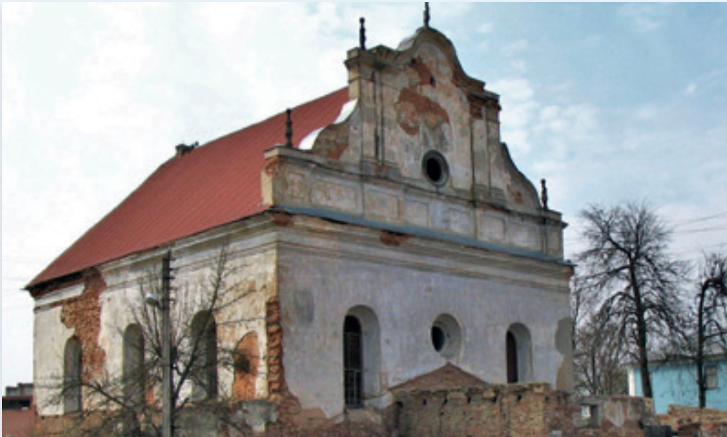
בית הכנסת הגדול בעיר סלונים (נחנך בשנת 1642)

כמים לים מכסים. ואף כי קטן יעקב ודל הוא זה הקטן גדול יהי' ובעתה אחישנה [...] שיעתיק מחכמת הלימודיות הכתובים בכל לשון מלשוננו הקדושה. כי היא האבן הראשה".