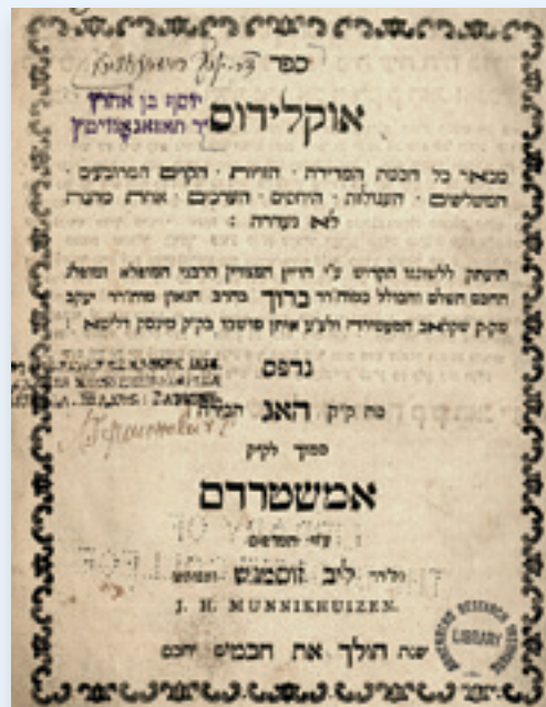
אוקלידוס, האג 1780 (תרגום עברי של החלק הראשון של "יסודות" מאת אאוקלידס)

המבקר הבריטי הסתייג באותה מידה משליטת המאגנטים הפולנים באמצעי הייצור ובכוח העבודה, שדיכאה יוזמות כלכליות, מנעה תחרות ושימרה את תפקידיהם הכלכליים המסורתיים של היהודים. ניתן לשער מדוע לא התלהב מן הפטרונות התרבותיות של אנשי האצולה, שייבאו תרבות מן המערב. ייתכן כי זאת הייתה הסיבה להתעלמותו מיוזמותיו הכלכליות והתרבותיות של פטרוֹן האומניות ועמיתו של דידרו, מיכל אוגינסקי, שבעירו בילה לילה אחד. ◀