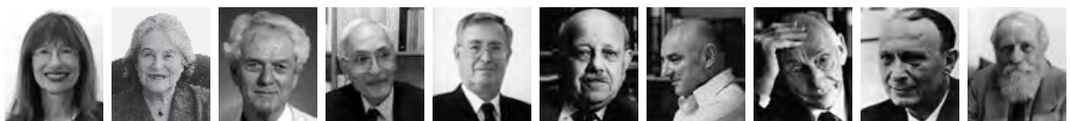
נשיאי האקדמיה מאז נוסדה (מימין לשמאל): פרופ' מרטין בובר ז"ל, פרופ' אהרן קציר ז"ל, פרופ' גרשם שלום ז"ל, פרופ' אריה דבורצקי ז"ל, פרופ' אפרים א' אורבך ז"ל, פרופ' יהושע יורטנר, פרופ' יעקב זיו, פרופ' מנחם יערי, פרופ' רות ארנון, פרופ' נילי כהן