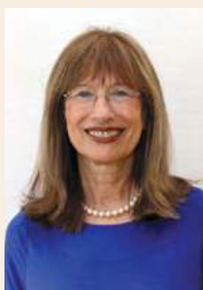
פרופ' נילי כהן נשיאת האקדמיה

אני מתכבדת להגיש את הדוח השנתי החמישי בתקופת כהונתי כנשיאת האקדמיה. העבודה על הדוח נעשתה בחודשים המורכבים שבהם התמודדנו אנו, המדינה, הקהילה המדעית והעולם כולו עם השלכותיה של התפשטות מגפת הקורונה. בעקבות המגפה נאלצה גם האקדמיה, ככל הגופים, לדחות כינוסים, אירועים וסדנאות וכן התמודדה היא עם אתגרים בניהול השוטף במסגרת המגבלות. עם פרוץ המגפה בארץ הקימה האקדמיה ועדה מיוחדת שדנה בהשלכות המגפה ובנושאים הנגזרים ממנה בטווחי זמן שונים. נקווה שלא ירחק היום, ונוכל לחזור לפעילות שגרתית, תוססת, שתאפשר לנו להיפגש ולפעול בחברותא.