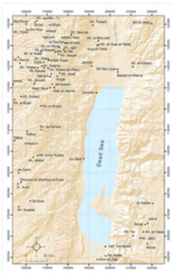
אחת משתי-עשרה המפות של אתרים עתיקים הנידונים בפרק 2 של האונומסטיקון.