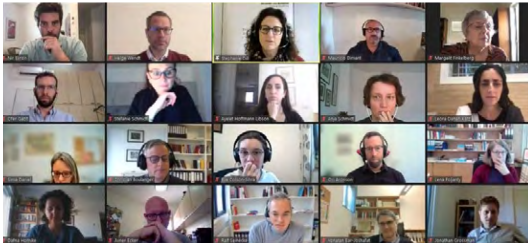
כינוס GISFOH ה־12.