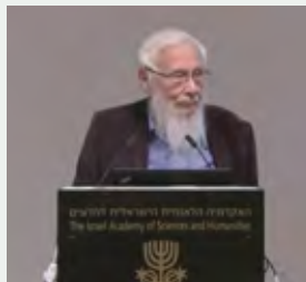
חבר האקדמיה, זוכה פרס נובל פרופ' ישראל אומן, בהרצאתו

בחודש נובמבר 2021 קיימה החטיבה הרצאה מיוחדת שאותה נשא חבר האקדמיה זוכה פרס נובל פרופ' ישראל אומן בנושא " כלכלה התנהגותית וכלכלה ". מההרצאה עלה כי שלא כמקובל לחשוב, אין סתירה בין כלכלה התנהגותית לבין כלכלה קלאסית – שתיהן נכונות והן תומכות זו בזו. נמצא כי בני אדם אינם מנתחים את מצביהם רציונלית אלא פועלים לפי כללי אצבע – ההטיות וההיוריסטיקות של הכלכלה התנהגותית. אלא שכללי אצבע אלה מתווים התנהגויות שהן בדרך כלל רציונליות, ולכן הנחת היסוד של הכלכלה הקלאסית – הרציונליות – מוצדקת, וכמו כן מסקנותיה.