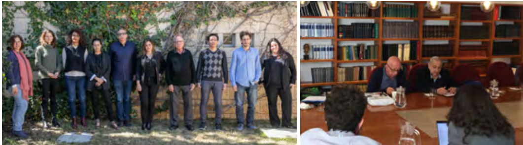
בתמונה הימנית (מימין): הסופר א"ב יהושע ז"ל וחבר האקדמיה פרופ' דן מירון במפגש פורום הצעירים; בתמונה השמאלית: משתתפי פורום צעירי מדעי הרוח והחברה, תשפ"ב

השנה מוביל את הפורום חבר האקדמיה פרופ' דן מירון, ונפגשים בו אחת לחודש קבוצת חוקרים צעירים המלמדים בחוגים לספרות עברית והשוואתית של האוניברסיטאות ושל המכללות. הפורום עוסק במושגי היסוד המתודיים המקובלים בחקר הספרות היהודיות בשפות שונות; בודק את המצאי הספרותי העצום לאורם ומציע להם חלופות. המשתתפים מקבלים מטלות קריאה ומציגים את הנושא הנדון ואת הטקסטים המדגימים אותו, וכן מתנהל דיון. השנה נהנו משתתפי הפורום משני ביקורים של הסופר א"ב יהושע ז"ל, שגם הקריא לפניהם את הנובלה האחרונה שלו "המקדש השלישי".