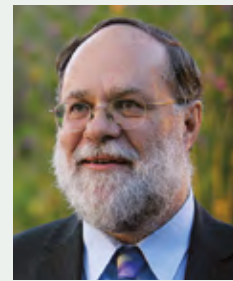
פרופ' סרג'יו הרט יו"ר החטיבה

בחטיבה למדעי הרוח 64 חברים מתחומים שונים במדעי הרוח והחברה: אנתרופולוגיה, ארכאולוגיה, בלשנות, דתות, היסטוריה, היסטוריה של עם ישראל, הלשון העברית, המזרח הקדום, לימודים קלאסיים, כלכלה, מדע המדינה, מזרח אסיה, מחשבת ישראל, מקרא, משפטים, סטטיסטיקה, ספרות, פילוסופיה ופסיכולוגיה. בראש החטיבה למדעי הרוח עומד פרופ' סרג'יו הרט. פעילות החטיבה כוללת תמיכה במפעלי מחקר, סימפוזיונים בין-לאומיים, ימי עיון והרצאות ובחינתם של נושאים שונים הנוגעים לתחומי מדעי הרוח והחברה. כמו כן מקדמת החטיבה פעילויות שונות ביוזמת חברה.