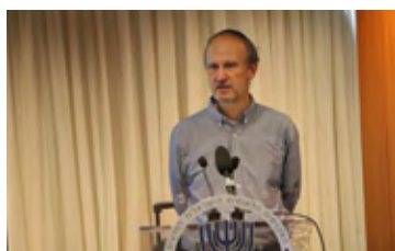
פרופ' טומאש טוארן בכינוס המשותף ישראל-הונגריה

שיתוף הפעולה עם האקדמיה למדעים של הונגריה הניב השנה שני כינוסים בני יומיים לציון 100 שנים למותו של חוקר האסלאם היהודי־הונגרי הנודע יצחק גולדציהר, בהובלת חבר האקדמיה פרופ' יוחנן פרידמן. הכינוס הראשון נערך בחודש נובמבר 2021 בבודפשט, ו הכינוס