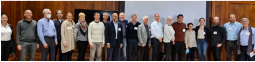
משתתפי הכינוס השני של פורום בלווטניק למדע ישראל-ארצות-הברית בנושא אסטרטגיות וטכנולוגיות למאבק בעמידות לאנטיביוטיקה, ושינוטון הבירה

בחדש אפריל נערך בווינגטון הבירה, על פי ההסכם עם האקדמיה למדעים של ארצות הברית, הכינוס השני של פורום בלווטניק למדע ישראל-ארצות-הברית, שעסק באסטרטגיות וטכנולוגיות למאבק בעמידות לאנטיביוטיקה. הובילו את הכינוס חברת האקדמיה זוכת פרס נובל פרופ' עדה יונת, פרופ' טימור באזוב מהטכניון – מכון טכנולוגי לישראל ופרופ' נטלי בלבן מהאוניברסיטה העברית בירושלים.