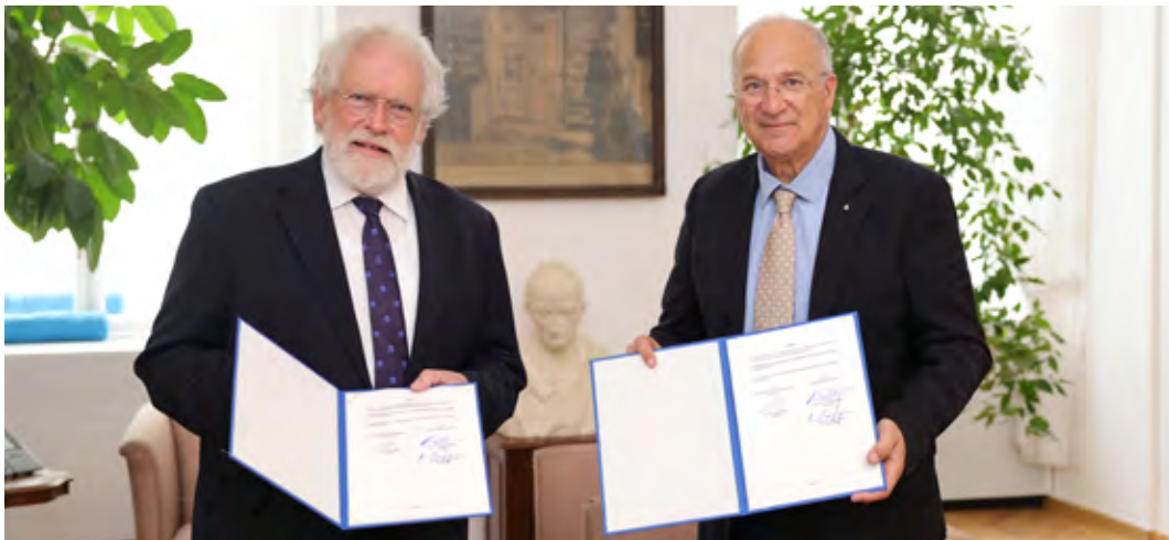
מימין: נשיא האקדמיה פרופ' דוד הראל ונשיא האקדמיה האוסטרית פרופ' אנטון ציילינגר במעמד החתימה על חידוש ההסכם לשיתוף פעולה מדעי.