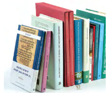
בשער פרק זה: מספרי הוצאה לאור של האקדמיה