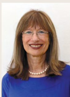
פרופ' נילי כהן נשיאת האקדמיה

אני מתכבדת להגיש את הדוח השנתי השישי בתקופת כהונתי כנשיאת האקדמיה. גם בשנה זו התמודדנו אנו, המדינה, הקהילה המדעית והעולם כולו עם השלכותיה המתמשכות של מגפת הקורונה. אנו מקווים כי קרב היום שבו נוכל לחזור לפעילות שגרתית, תוססת, להיפגש ולפעול בחברותא.