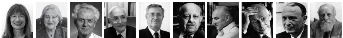
נשיאי האקדמיה מאז נוסדה (מימין לשמאל): פרופ' מרטין בובר ז"ל, פרופ' אהרן קציר ז"ל, פרופ' גרשם שלום ז"ל, פרופ' אריה דבורצקי ז"ל, פרופ' אפרים א' אורבך ז"ל, פרופ' יהושע יורטנר, פרופ' יעקב זיו, פרופ' מנחם יערי, פרופ' רות ארנון, פרופ' נילי כהן