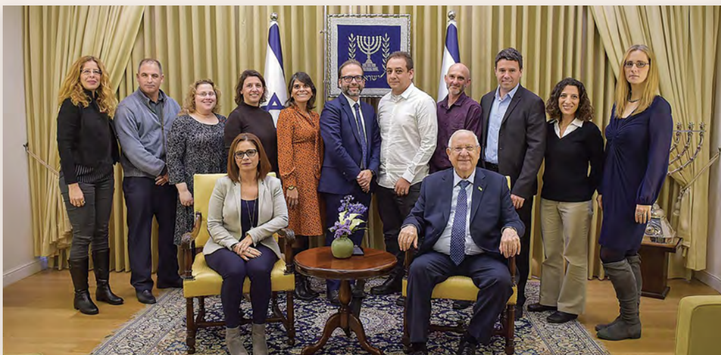
נציגי האקדמיה הצעירה הישראלית בביקור בבית נשיא המדינה מר ראובן (רובי) ריבלין בירושלים.

נשיא המדינה מר ראובן (רובי) ריבלין אירח את נציגי האקדמיה הצעירה במשכנו שבירושלים בחודש פברואר. החברים הציגו לפני הנשיא את המטרות האסטרטגיות העיקריות של האקדמיה הצעירה: קידום חוקרות וחוקרים צעירים וחיזוק הקשר בין האקדמיה לקהילה. הנשיא הביע עניין רב בחסמים העומדים בפני תלמידים ערבים בכניסה לאוניברסיטאות.