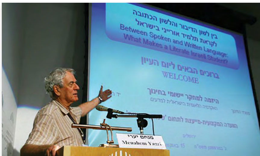
פרופ' מנחם יערי נושא דברים ביום עיון של ה"יזמה - מרכז לידע ומחקר בחינוך", 2008

בעת כהונתו היה פרופ' יערי מעורב גם בהקמת ה"יזמה למחקר יישומי בחינוך", או בשמה כיום "יזמה - מרכז לידע ומחקר בחינוך". ה"יזמה" הושקה בתחילת שנות האלפיים כמיזם משותף של האקדמיה הלאומית הישראלית למדעים, משרד החינוך וקרן "יד הנדיב". המיזם שם לו למטרה להשתמש בידע מחקרי בתהליכי העיצוב של מדיניות חינוך.