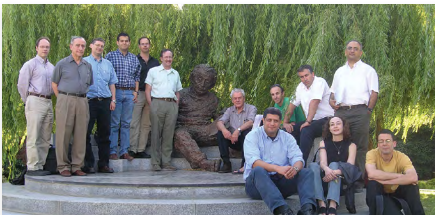
מפגש פורום הצעירים השני של החטיבה למדעי הרוח, יוני 2005. פרופ' מנחם יערי יושב במרכז.

פרופ' יערי, חבר האקדמיה משנת 1992, נבחר ב-2004 לכהונת נשיא האקדמיה ושימש בתפקיד עד שנת 2010. כשהוא מתבקש לציין הישג מסוים מתקופת כהונתו הוא עונה: "בפעילות שאני מורגל בה מדגישים הישגים מדעיים. לתאר הישג בתפקיד ארגוני שמילאתי – קשה יותר".